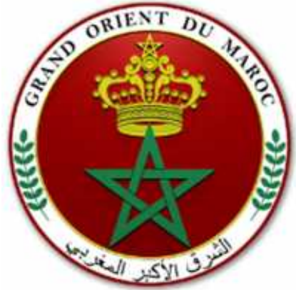
الشرق الأكبر المغربي